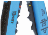
Модуль для опрессовки WS-07

Предназначен для опрессовки втулочных наконечников типа НШВ, НШВИ сечением от 0,5 до 6,0 мм 2