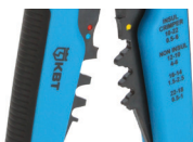
Модуль для опрессовки WS-04A

Возвратные пружины (2шт.) служат для возврата прижимных губок и рукояток в исходное положение