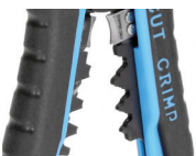
Модуль для опрессовки WS-11

Предназначен для опрессовки изолированных гильз и наконечников сечением от 0,5 до 6 мм 2 (НКИ, НИК, НВИ, ГСИ, НШКИ, НШПИ, изолированных разъемов), а так же неизолированных гильз и наконечников, в том числе и автоклемм