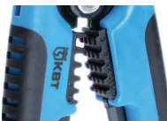
Модуль для опрессовки WS-04B

Предназначен для опрессовки изолированных гильз и наконечников сечением от 0,5 до 6 мм 2 (НКИ, НИК, НВИ, ГСИ, НШКИ, НШПИ, изолированных разъемов) и неизолированных гильз и наконечников сечением от 0,5 до 6 мм 2 (ГМЛ, ГМЛ(о), ТМ, ТМЛ, ТМЛ(о), автоклемм)